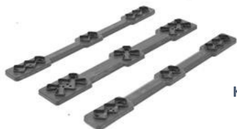
Kit 3 traverse